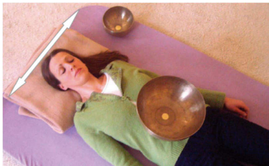
Afb. 3: bilaterale stimulatie. Het langzaam, afwisselend zacht aanslaan van de hartschaal (boven in beeld) in de buurt van het Tinnitus- dan wel het andere oor. Hierbij heeft de cliënt de opdracht de toon van de hartschaal te volgen. Deze werkwijze heeft zich in het bijzonder bij eenzijdige tinnitus bewezen.

Bij eenzijdig oorsuizen heeft de methode van de bilaterale stimulatie zich bewezen. Nadat de toestand van zekerheid en ontspanning bereikt is, volgt het zacht aanslaan van een schaal, langzaam en afwisselend bij het tinnitus oor en het andere oor, waarbij de cliënt de toon blijft volgen (afb. 3). Deze methode is vergelijkbaar met de psychologische EMDR-techniek (Eye Movement Desensitization Reprocessing). Net als bij EMDR nemen we aan dat bij het werken met klankschalen nieuwe synaptische verbindingen en activiteitspatronen op het niveau van zenuwnetwerken ontstaan door het stimuleren van gebieden in beide hersenhelften. Uiteindelijk brengt dit een emotionele herinterpretatie van het oorsuizen en bevordert dit gewenning bij de cliënt. Op welke wijze de emotionele herwaardering van de tinnitus en de gewenning bij de cliënt bereikt worden is van ondergeschikt belang. In alle gevallen heeft het tot gevolg dat het oorsuizen in het vervolg langer en vaker naar de achtergrond verdwijnt. Hierdoor kan de belasting van het oorsuizen verminderd worden, zozeer zelfs dat de tinnitus in sommige gevallen geheel 'vergeten' wordt.